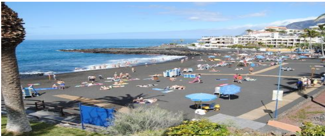
Playa de la Arena, Termino Municipal de Santiago del Teide, Llegada de la Travesía a Nado SOUTH WEST LANDMAR.