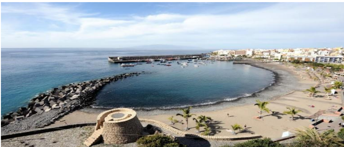
Playa de San Juan 2 Control a los 20 Km aproximadamente de la Salida