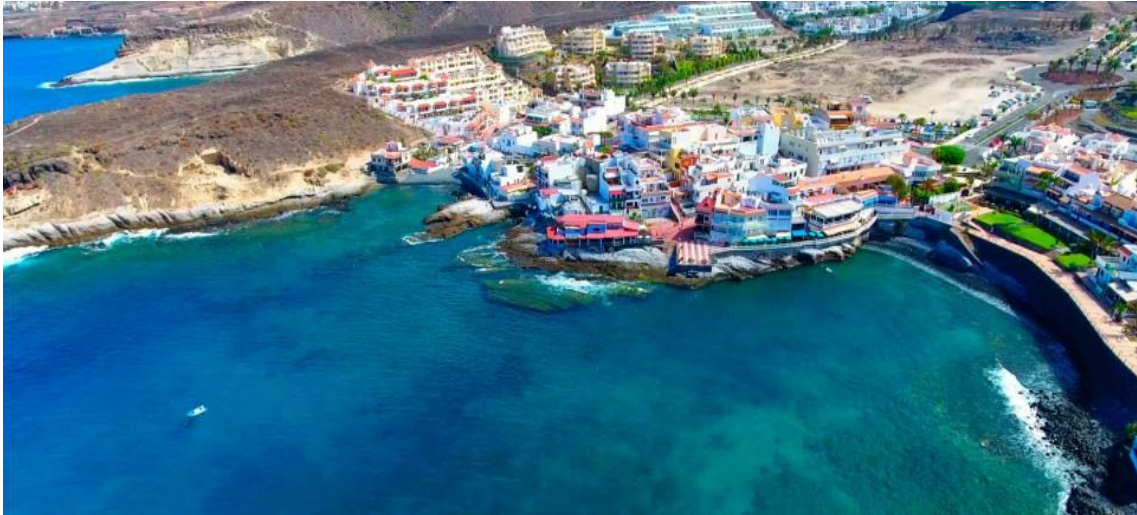
Caleta de Adeje 1 Punto de Control a los 10km aproximadamente de la Salida

El recorrido será lineal y habrá cuatro puntos de control: el primero de ellos en la Salida. El segundo a los 10 kilómetros en La Caleta de Adeje en el Municipio de la Villa de Adeje. El tercero a los 20 kilómetros, en Playa de San Juan en el Municipio de Guía de Isora y por último en la llegada a la Playa de la Arena en el municipio de Santiago del Teide donde finalizará dicha prueba con aproximadamente unos 30 kilómetros, siendo esta prueba la más larga oficial de España.