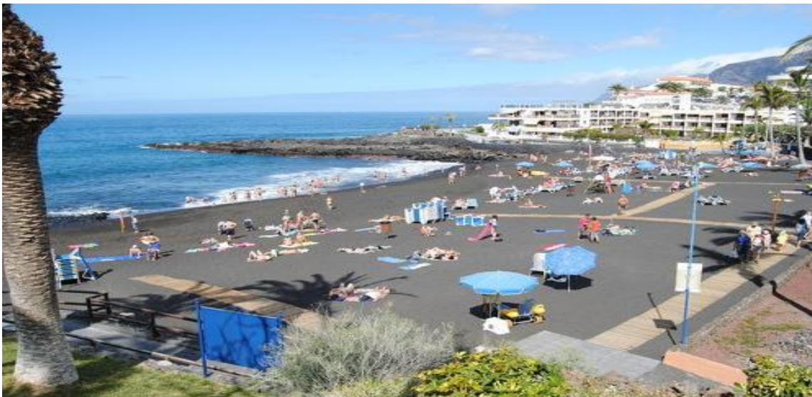
Playa de La Arena, Meta I Travesía a Nado SOUTH WEST LANDMAR.

12.4 La Organización se reserva el derecho de rechazar cualquier inscripción que no acepte los términos y condiciones que queden expuestos en el presente reglamento.